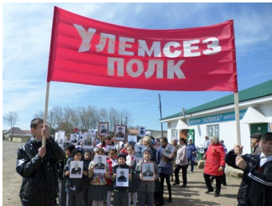
Шествие «Бессмертного полка»