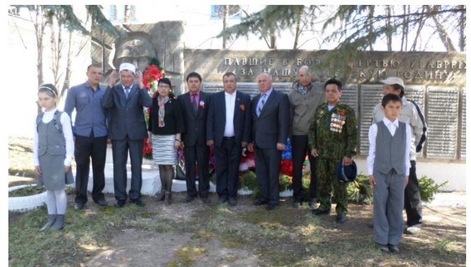
У мемориальной доски